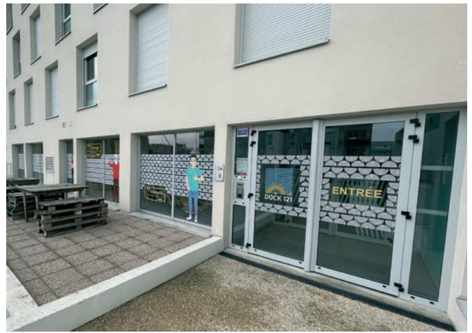
doc. Forbo Flooring Systems

Pour agencer ces logements, la salle de sport et les couloirs, plusieurs revêtements Forbo Flooring ont donc été sélectionnés : 2 603 m 2 de PVC acoustique Sarlon habitat sont ainsi venus parer les parties privatives, affichant une résistance à la glissance R10 sur l'ensemble des coloris pour garantir là-encore sécurité et confort, le motif Bois réchauffant les pièces à vivre. Côté parties communes, 380 m 2 de Sarlon primeo et 187 m 2 de Sarlon primeo compact ont été mis en œuvre, deux sols PVC hétérogènes disposant du meilleur compromis acoustique / poinçonnement de leur catégorie. Enfin, 40 m 2 de Sarlon marche complète ont été appliqués au niveau des escaliers. Soulignons également que les salles de bains ont bénéficié du système Sarlibain , garant d'une étanchéité parfaite, de sécurité et de facilité d'entretien.