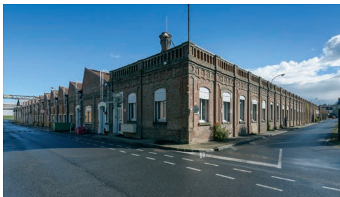
Siège social et site de production de Forbo Flooring

doc. Forbo Flooring / Editions du Signe © Fred Laures