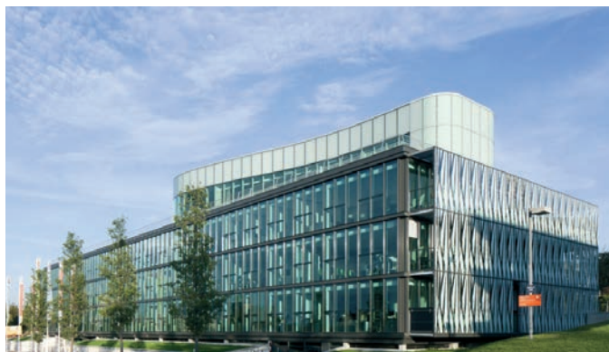
Siège social du Foyer Rémois

Soulignons que la mise en œuvre de Modul'up se révèle deux fois plus rapide que celle d'un sol collé, avec une durée d'immobilisation des locaux réduite de 80 % et assure une mise en service immédiate (atouts indéniables en milieu occupé). Toute dépose ultérieure sera également instantanée et sans dégradation (aucun risque d'arrachage, ni travaux de ragréage).