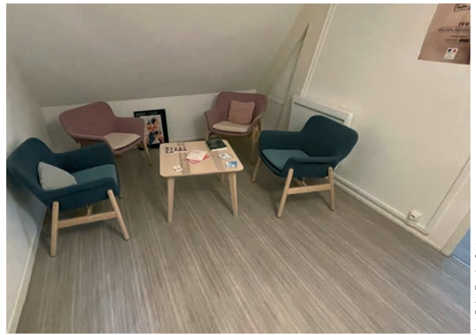
doc. Forbo Flooring Systems